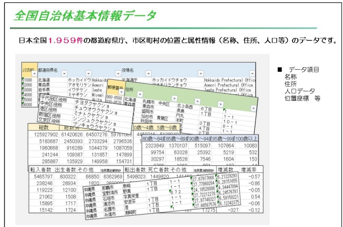
【都道府県別件数表】